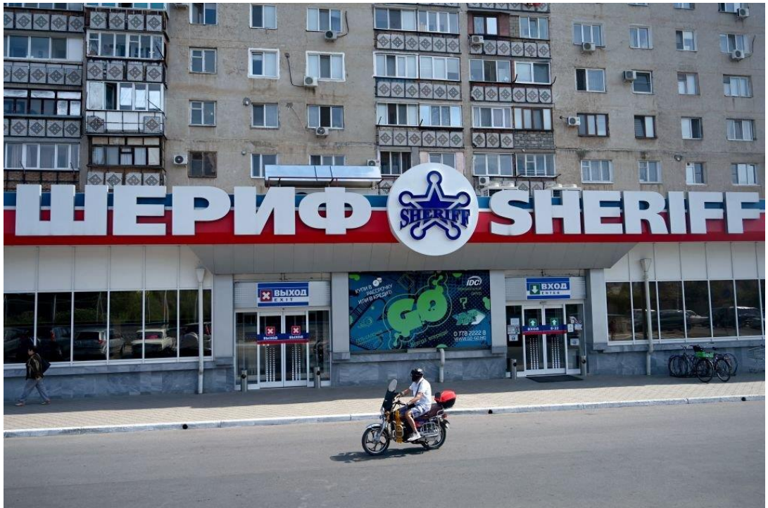
图：谢里夫公司的招牌

面包店，以及一个手机网络、一家酿酒厂、一支足球队、一个小型的广播和电视台帝国。在当地，谢里夫公司被人们简称为“公司”（the firm）。