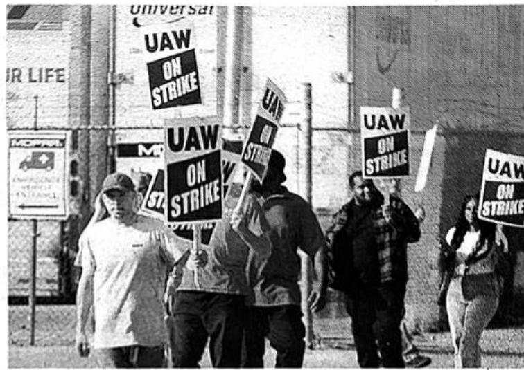
22日，美国罢工工人在密歇根州的斯泰兰蒂斯工厂外举牌游行。

一些重大问题需要解决，但我们确实希望承认福特已经表明他们真的想达成协议。通用和斯泰兰蒂斯则不同。”