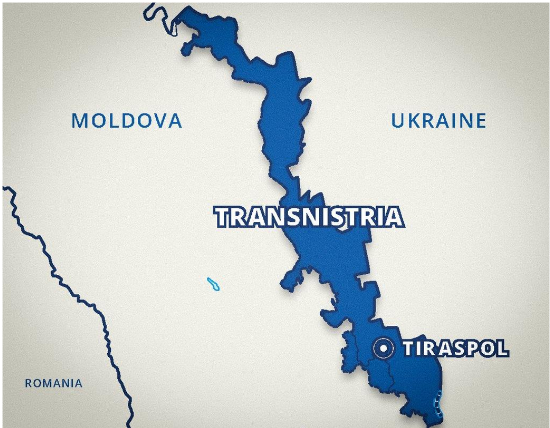
图：德涅斯特河沿岸地区东侧为乌克兰，西侧为摩尔多瓦政府控制区。

德河沿岸是一块狭长的分裂地区，它与乌克兰之间有一条 400 公里长的边界线。去年普京发动对乌全面入侵以来，德河沿岸的命运急剧地吸引了许多人的关注。