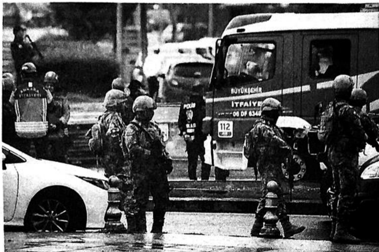
1日,在安卡拉发生爆炸袭击事件后,土耳其安全人员在内政部附近执勤。

【法新社安卡拉10月1日电】周日,在库尔德工人党在安卡拉市中心发动自杀式恐怖袭击致两人受伤后不久,土耳其对“恐怖分子”发出警告并对伊拉克的该组织目标发动空袭。