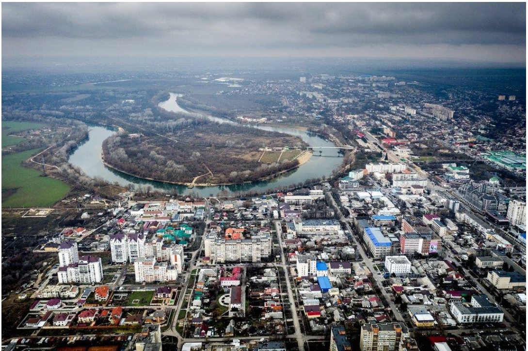
图：德涅斯特河沿岸地区首府蒂拉斯波尔

负责制定摩尔多瓦政府对德河沿岸地区政策的重新统一局（Reintegration Bureau）则提议：在欧洲安全与合作组织驻摩尔多瓦代表团的基础上成立一个独立调查组。欧洲安全与合作组织也已和美国使馆、欧盟代表团一道要求开展诚实的、客观的调查。 [2]