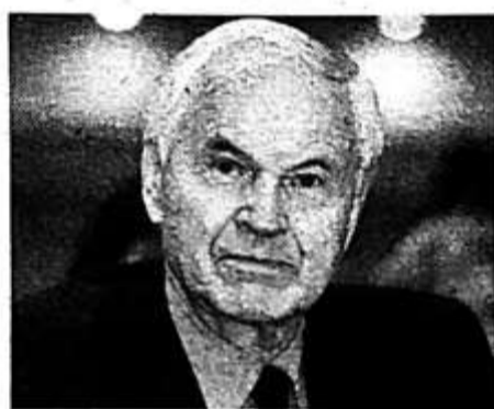
汉斯·莫德罗（资料图片）

莫德罗1928年1月27日出生于当时东普鲁士的波利采（现在属于波兰领土）。在第二次世界大战结束之际，他被苏联军队俘虏并关入改造营。后来他加入德国统一社会党。他担任过许多职务，负责过各类工作，包括柏林和德累斯顿下辖城区的德国统一社会党领导人。