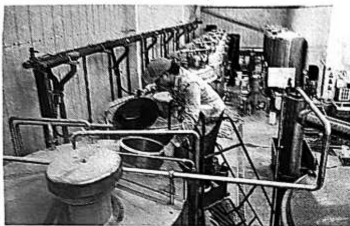
英国伦敦的一家啤酒厂参加了四天工作制试验。图为该厂工人正在检查酿酒桶。

【西班牙《国家报》网站2月21日报道】在6个月前参加英国四天工作制试验的61家公司中，有56家决定延长四天工作模式。而其中18家公司已经