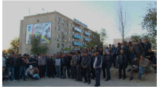
图：卡拉赞巴斯油气田工人在公司总部前示威（2011 年）

系的公司，为石油生产商提供和维修设备。全体员工（约 1000 人）举行了罢工。为了声援这次罢工，另一场罢工在阿克套州的卡拉赞巴斯油气田公司（Karazhanbasmunai）开始了。