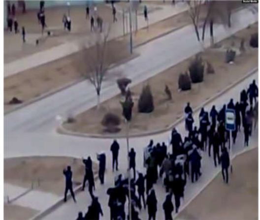
图：扎瑙津居民发到网上的视频截图，显示 2011 年 12 月 16 日警察（前排）向示威者开枪

答：我认为我们非常幸运，这些片段准确地展示了客观事实。它们出现在总检察长发表声明的第二天。那份声明称，骚乱是由那些据称开始了大屠杀的破坏分子引起的，他们向警察开枪。事实上，从视频中可以清楚地看到，没有人威胁警察，是一支警察部队来到广场并开始射击。